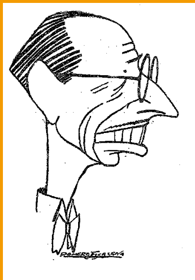
ÍGOR STRAVINSKI ABC, 23 DE NOVIEMBRE DE 1933, PÁG. 44