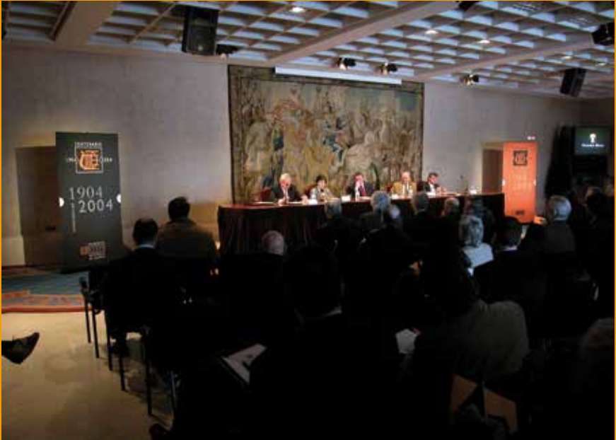
PRESENTACIÓN DE LAS ACTIVIDADES DEL CENTENARIO DE LA ORQUESTA SINFÓNICA EN EL TEATRO REAL.

frente del Teatro Real. Lo que ha dado al proyecto de la OSM solidez y proyección de futuro, unido a un compromiso de mayor autoexigencia.