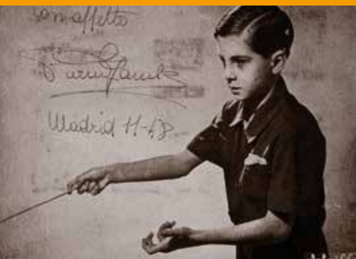
PIERINO GAMBA EN 1948

a la mínima expresión, las pocas convocatorias que tienen no se atreven a calificarlas como temporadas de conciertos. Todos los componentes de la orquesta viven de otros trabajos. Prácticamente la OSM se mantiene de la caridad del Ministerio de Información y Turismo, que la contrata dentro de la programación de los Festivales de España.