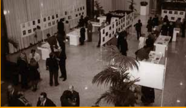
EXPOSICIÓN DEL 90º ANIVERSARIO EN EL AUDITORIO NACIONAL DE MÚSICA (1994). ARCHIVO DE LA OSM

En esas fechas ya se había empezado a hablar del paso de la OSM desde el Teatro de la Zarzuela al futuro Teatro Real, cuando acabaran las obras de rehabilitación que se estaban llevando a cabo. En ese ambiente la orquesta decide hacer un considerable esfuerzo durante todo el año 1994 para festejar su 90º cumpleaños. Un buen número de encargos a compositores españoles, que se estrenan y se graban en disco, un libro que