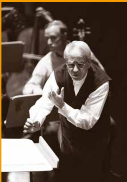
CRISTÓBAL HALFFTER DIRIGIENDO A LA ORQUESTA EN EL TEATRO REAL.

A partir de ese momento, y siempre con el apoyo de los responsables artísticos y administrativos del Teatro, la OSM puso en marcha un riguroso programa de mejora continua de sus niveles de calidad que le valieron la renovación sistemática de su contrato como Orquesta Titular del Teatro Real, contratos que se renovaban para una vigencia temporal creciente, con lo que se logró una estabilidad del conjunto que, en definitiva, redundó en mayor amplitud y ambición de su plan de mejora artística. De esta manera la