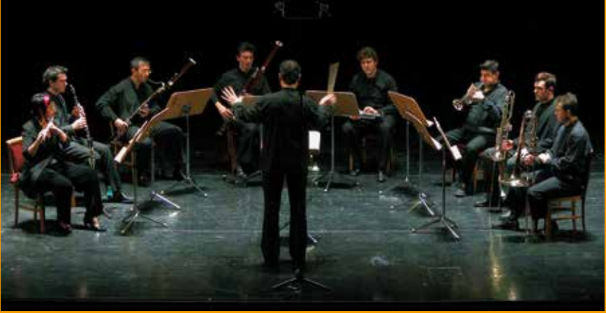
SOLISTAS DE LA ORQUESTA SINFÓNICA EN EL CICLO DE CONCIERTOS DE CÁMARA EN EL TEATRO REAL.

la OSM ha logrado la supervivencia de su ciclo de conciertos.