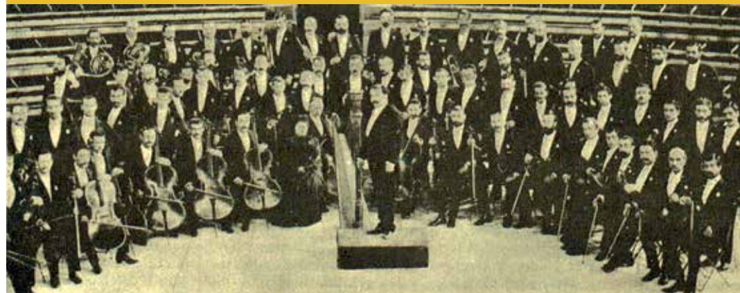
La Sociedad de Conciertos. La Ilustración Musical Hispano-americana, 1891