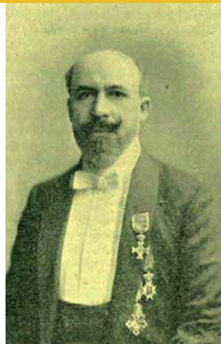
Alonso Cordelás. El Álbum iberoamericano, 1903

Como antes con la Sociedad de Conciertos, desde 1903 hasta 1925 la Sinfónica de Madrid y la Orquesta del Teatro Real estaban formadas por los mismos músicos, aunque fueran instituciones independientes. Esa identidad y dualidad se reproduce desde 1997 hasta la actualidad porque, en ese escenario, la Orquesta Sinfónica de Madrid actúa con el