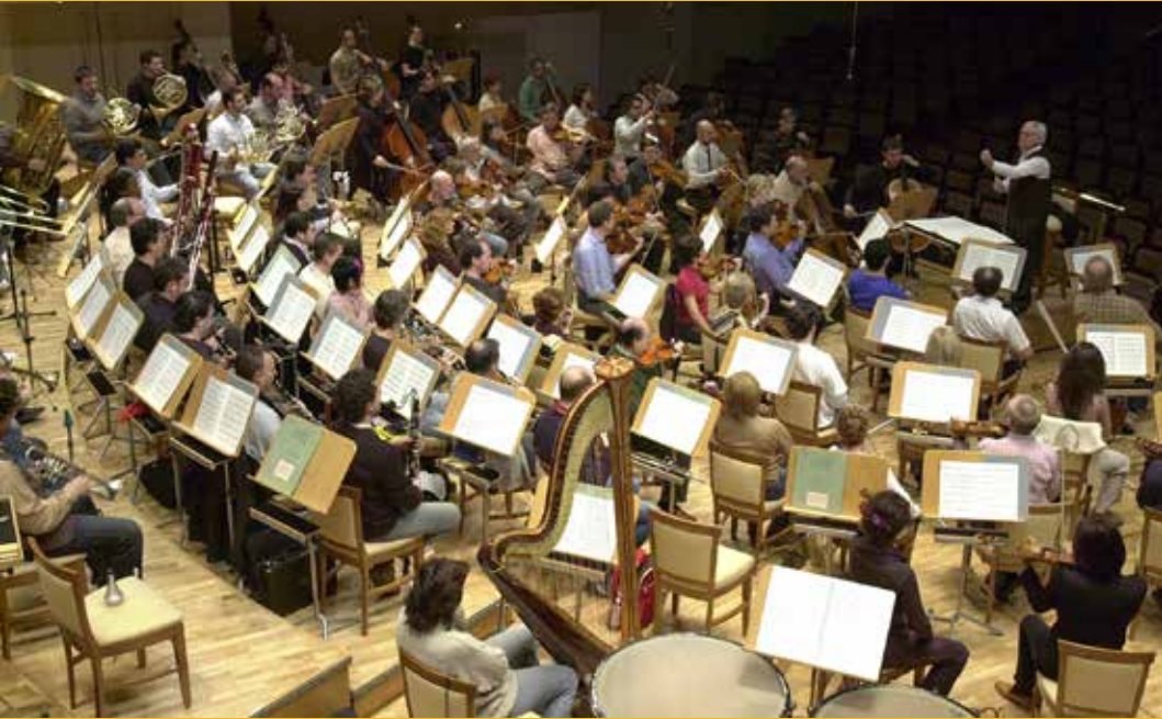
Cristóbal Halffter dirigiendo a la OSM.