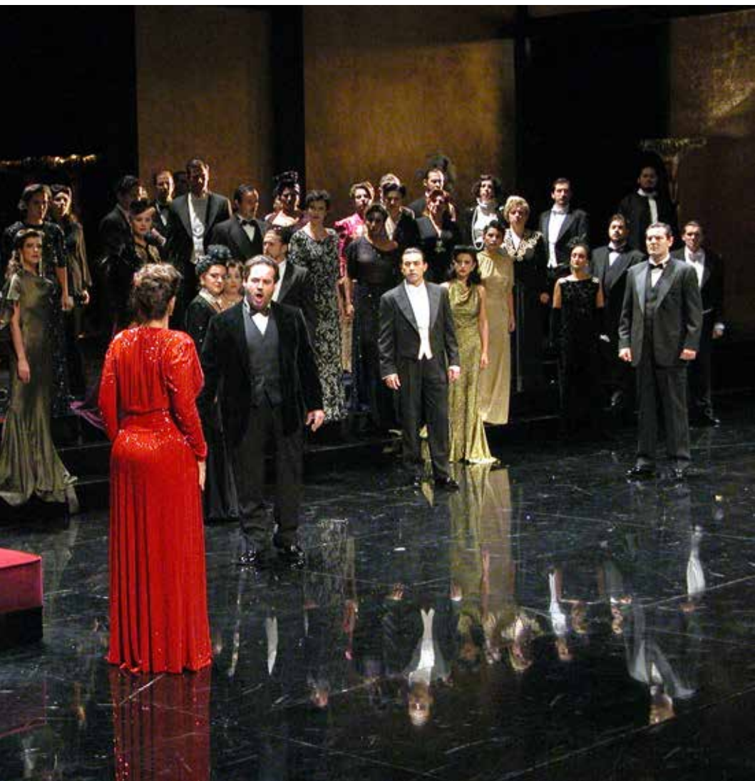
Coro de la OSM.

exigencia de calidad artística a cambio de mejoras en la estabilidad como Orquesta Titular del Teatro Real.