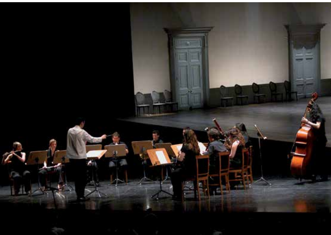
Orquesta-Escuela de la OSM (Foto: Javier del Real).

orquestal, primero con sus compañeros y más tarde con colaboraciones esporádicas con la OSM.